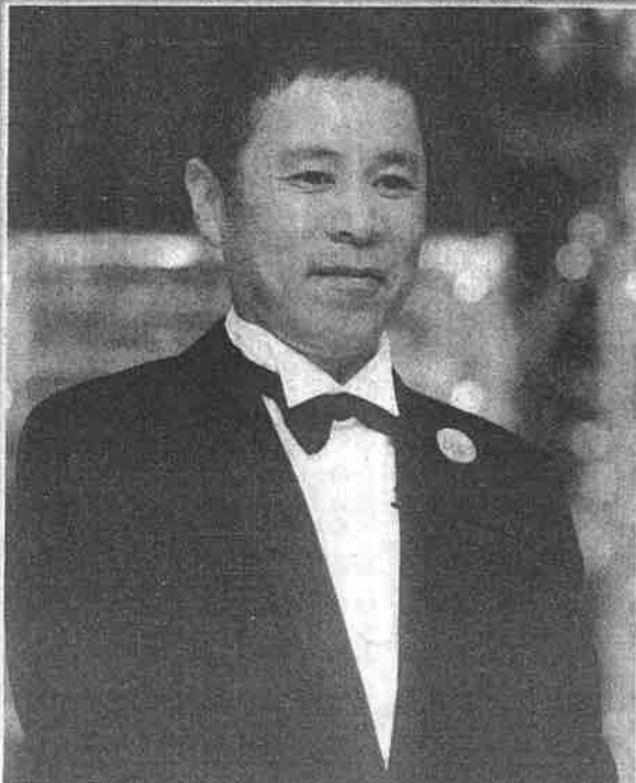
ナインティナインの岡村隆史

この知恵や弁と財福を授けてくれる女神の調査をした経験がある。顔は美しいが、元大関の小錦風のデブが多い。