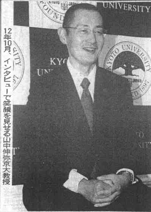
12年10月、インタビューで受領を見せる山中伸弥京大教授

特許も取らず、世界中の研究者に利用して欲しいという山中教授。「ジヤマナカ」の命名者は、「神の手」を持っていたが、山中教授は「万能神の手」を持ち、私は「奥の手」を持っていた。