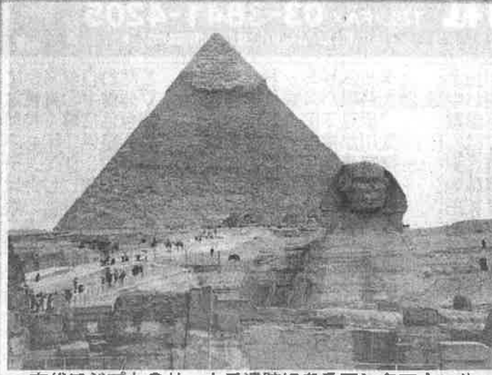
古代エジプトのサツカラ遺跡にあるアंकマホールの墓には、割礼の様子を示す壁画がある。写真はカフラ王のピラミッド(左)とスフィンクス

コレラやペスト、赤痢等、数えきれない疾病で、あなたも自然淘汰(どうた)のごとく人の命が奪 わられてきた。しかし、人類が歴史的に恐れたのは、「性病」ではなかったかと私は考える。 エジプトのカイロ郊外のサツカラ遺跡にあるアंकマホール(BC24世紀頃か)に興味ある壁画がある。性病を防止