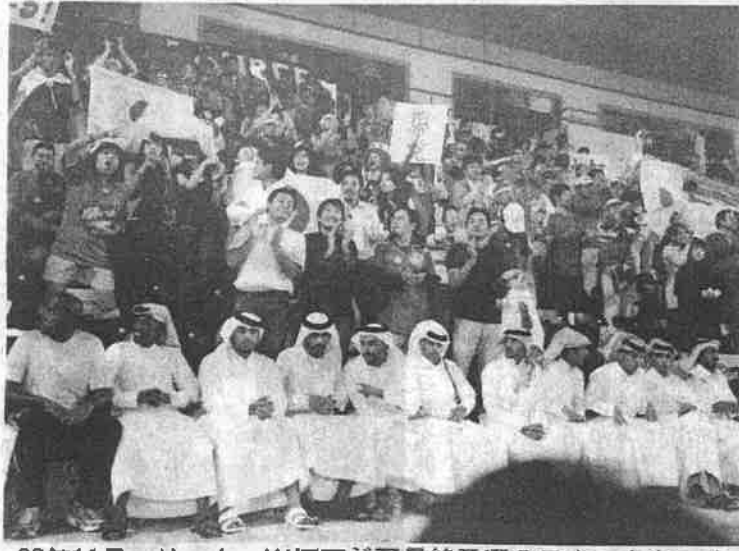
08年11月、サッカーW杯アジア最終予選の日本-カタール戦で声援を送る日本サポーターとカタールのサポーター

います。日本人学校はOK、わが政府が金を出します。私は大賛成です」と若き殿下。ビックリした。カタール政府が日本人学校を作ってくれるのだ。条件は、学校内にイスラム教の礼拝所を設ける。給食には豚肉を使用しない。現地人の女兒には頭にスカーフの着用を認める。ただ、教室内でのスカーフは認めないと拒否したが、殿