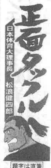
日本体育連盟理事長 松浪健四郎